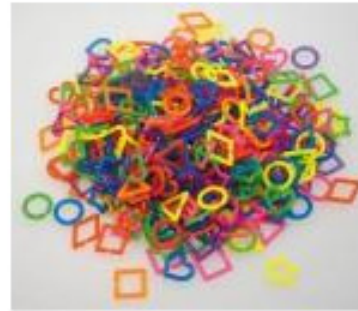
Click Pärlor 500st