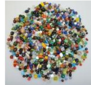
Glaspärlor, 1 kg, mix